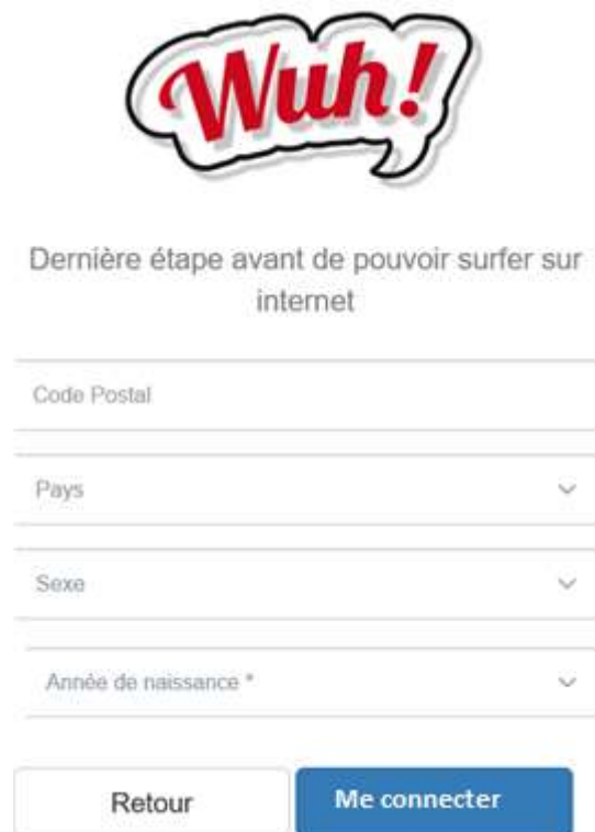
Figure 7 - Formulaire de création de compte « ACCOUNT CREATION 2 »

Le formulaire « ACCOUNT CREATION 2 » contient les champs supplémentaires non obligatoires suivants: