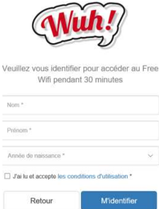
Figure 3 - Formulaire d'identification « FORM 30MIN »

Un minimum d'informations est demandé à l'utilisateur via le formulaire « FORM 30MIN » :