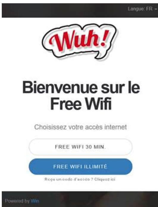
Figure 2 - Page d'accueil

La page d'accueil invite l'utilisateur à choisir un des profils d'accès « Free Wifi 30 minutes », « Free Wifi illimité » ou l'utilisation d'un « code d'accès ».