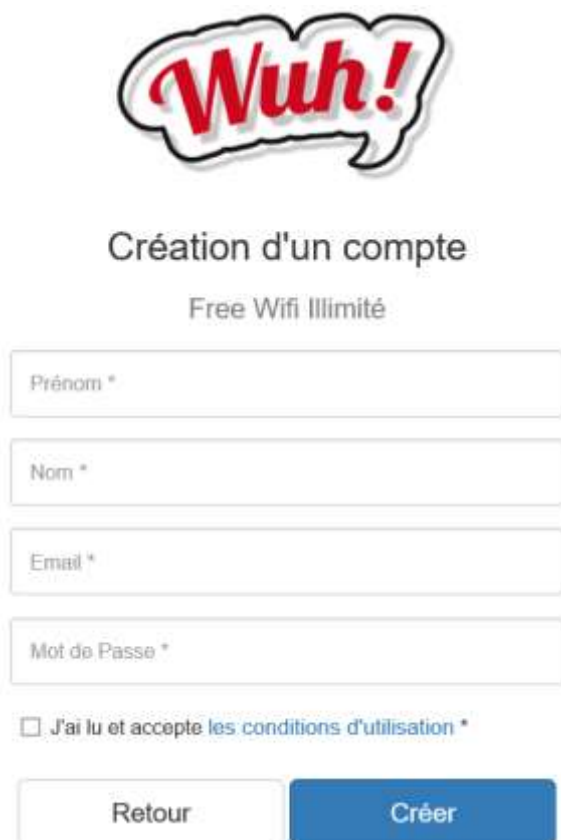
Figure 6 - Formulaire de création de compte « ACCOUNT CREATION 1 »

Le formulaire « ACCOUNT CREATION 1 » invite l'utilisateur à créer un compte avec les champs obligatoires suivants :